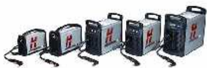
АППАРАТЫ ПЛАЗМЕННОЙ РЕЗКИ